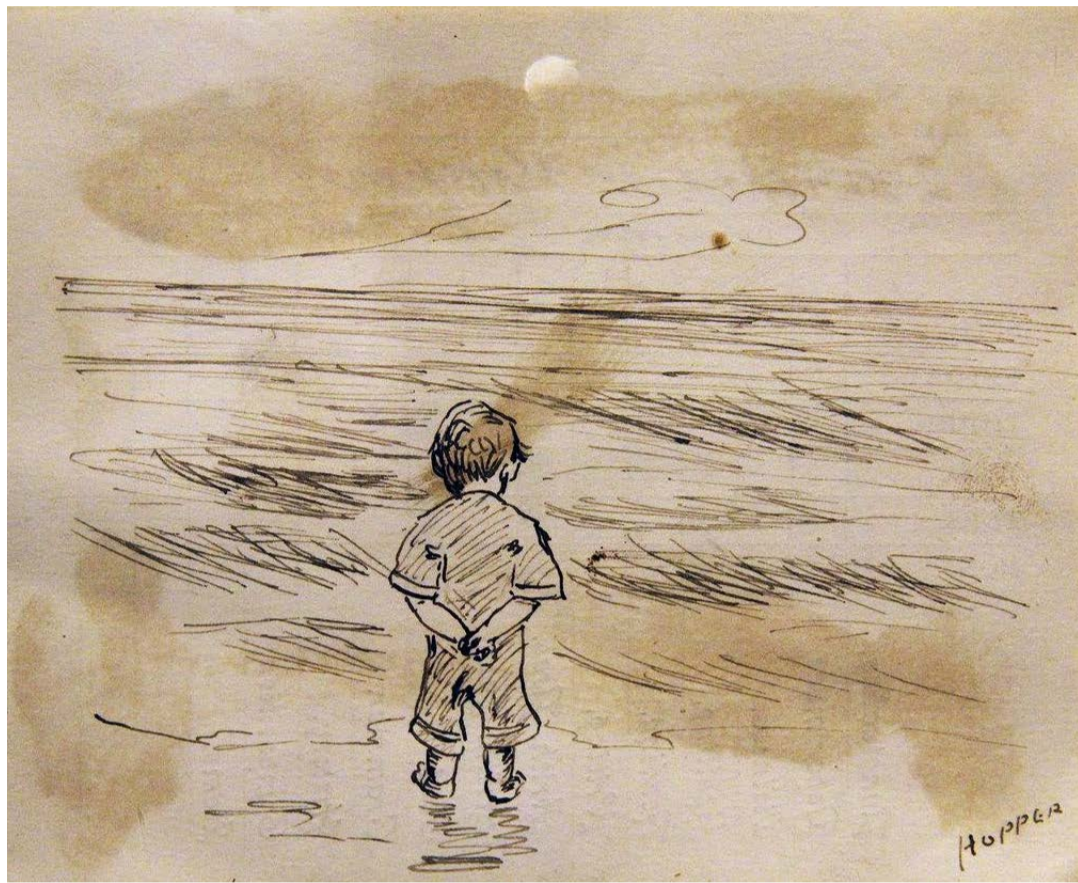
"Τὸ κύμα τότε εἰς ἄχνην λεπτήν μεταβαλλόμενον..." Ἀλέξανδρος Μωραϊτίδης