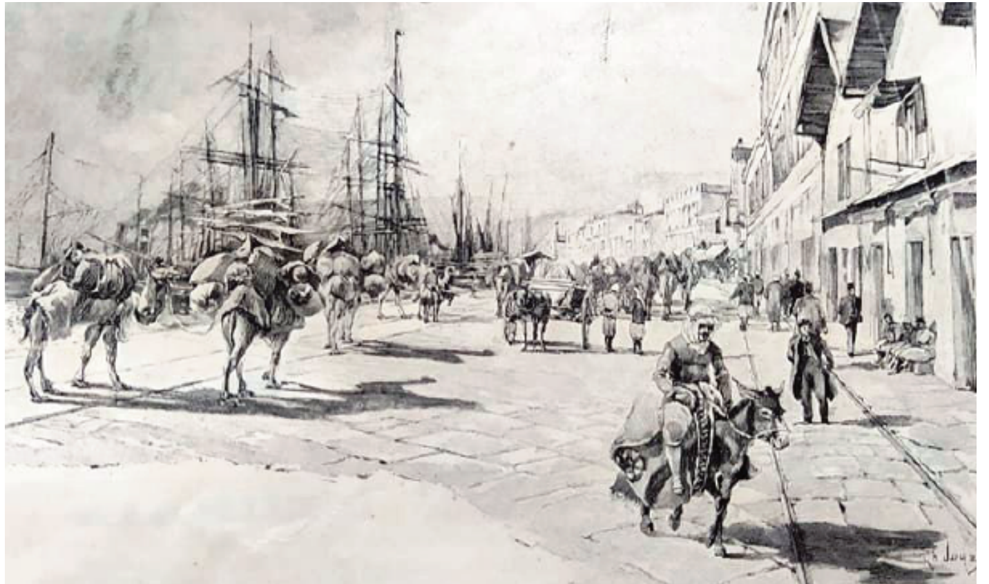
Ἐμπορικὸν τμήμα τῆς Προκουμιάς Σμύρνης. Πρωτοχρονιάτικο φύλλον τῆς ἐφημερίδας ΗΜΕΡΗΣΙΑΣ τῆς Σμύρνης, 1907.